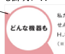
ビットマップ形式